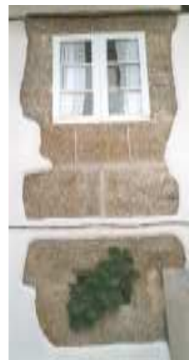
RÚA DE SANTA MARÍA (BETANZOS)